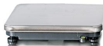
Рисунок 1 — Общий вид весов