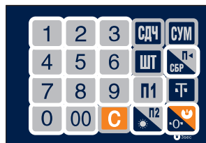
Рис. 3. Клавиатура