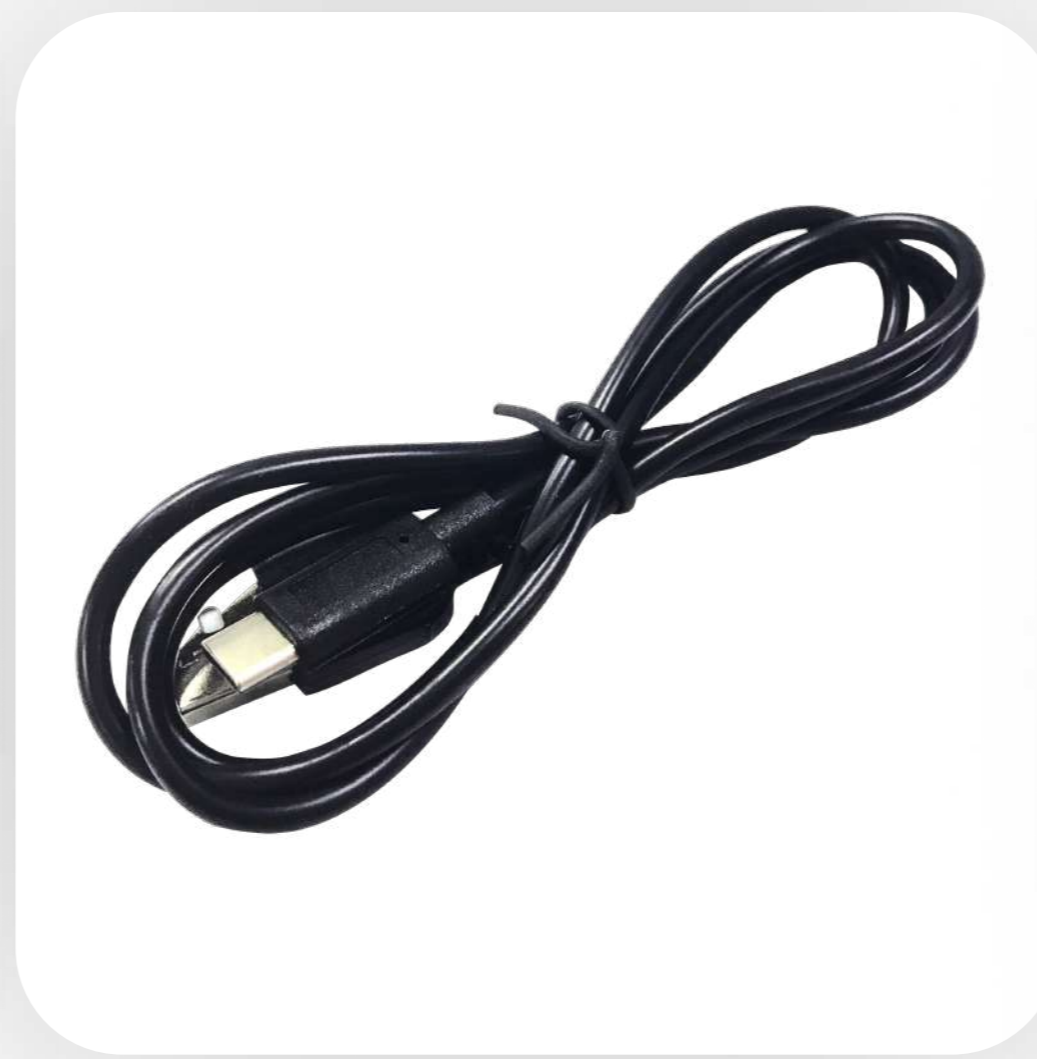
Кабель USB - Type-C