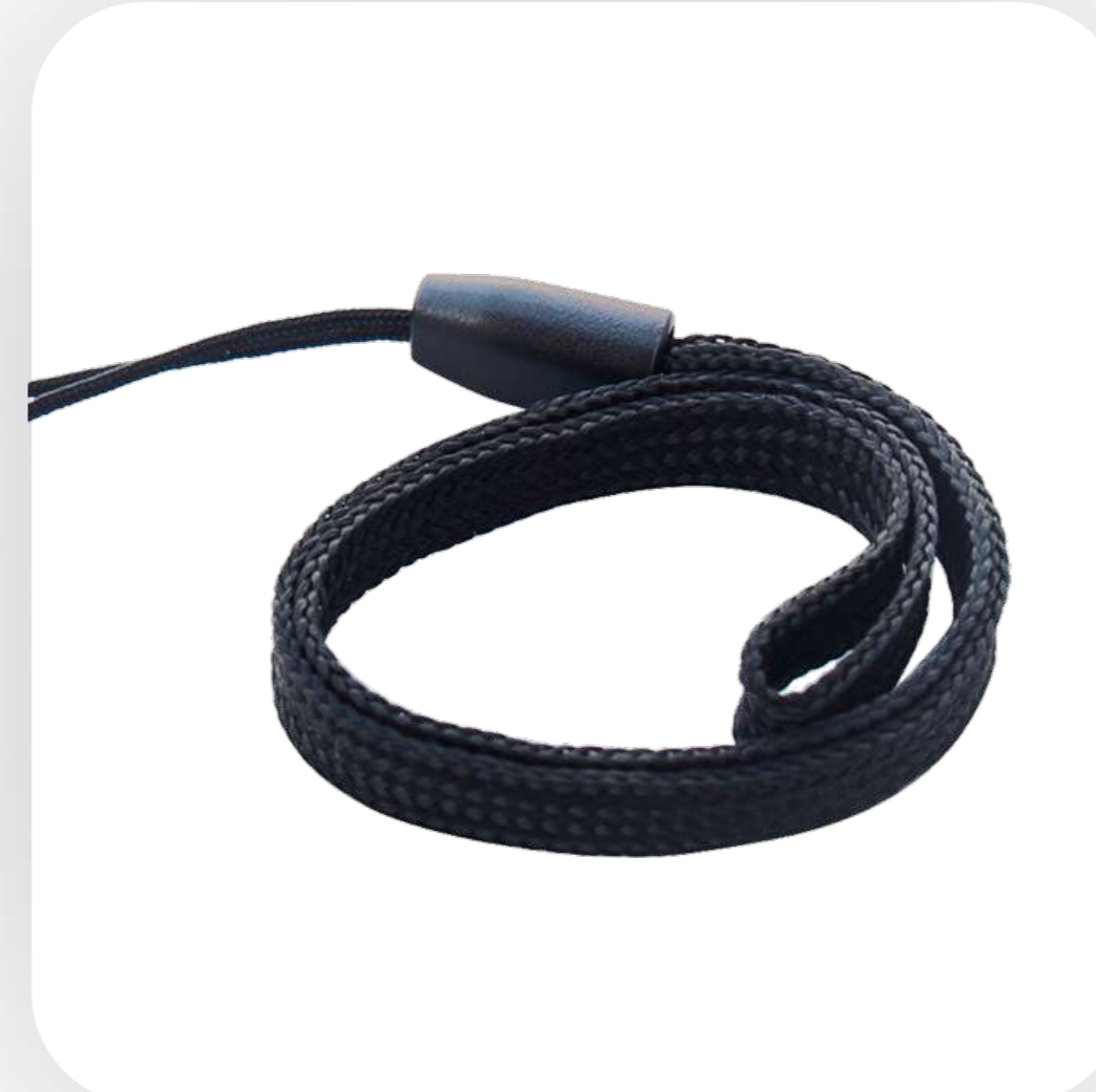
Ремешок на запястье легко закрепить и снять. Повышает эргономику работы с ТСД.