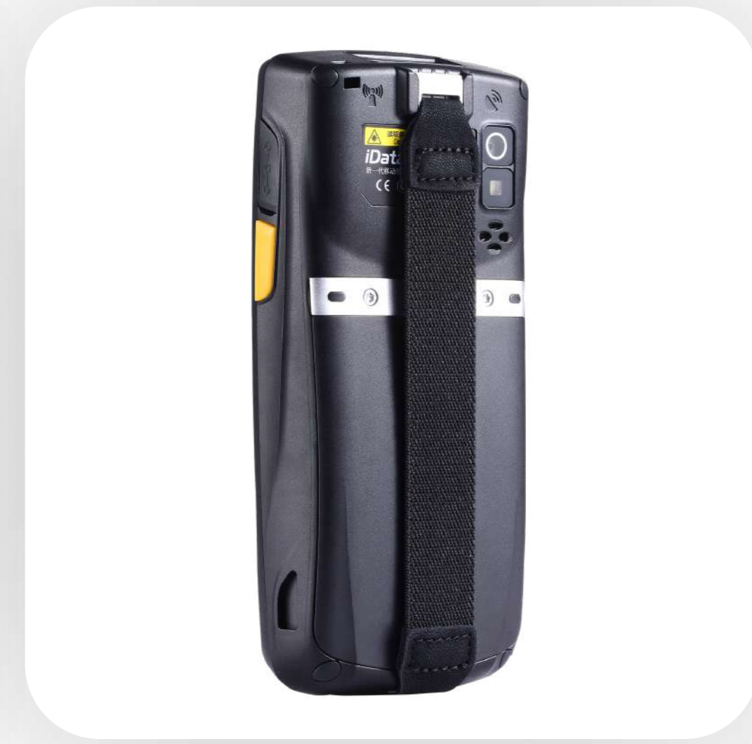
Ремешок на заднюю часть корпуса