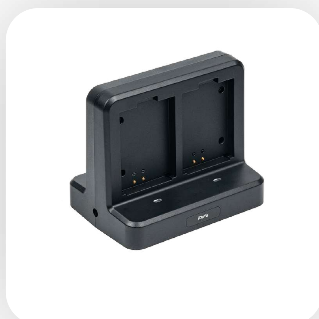
4-слотовая зарядная подставка для АКБ