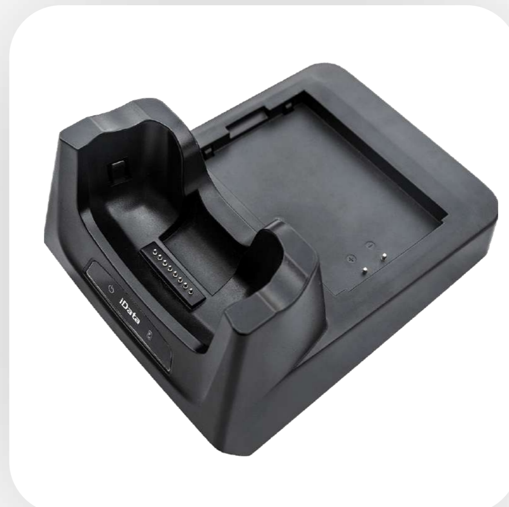
Зарядная подставка для ТСД и АКБ