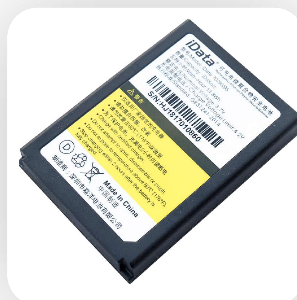
Батарея на 6000 мАч