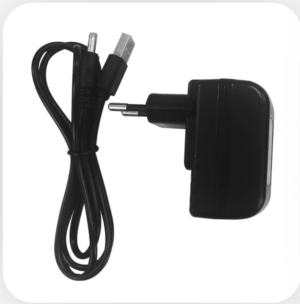
Адаптер питания с выходным напряжением 5В/2А